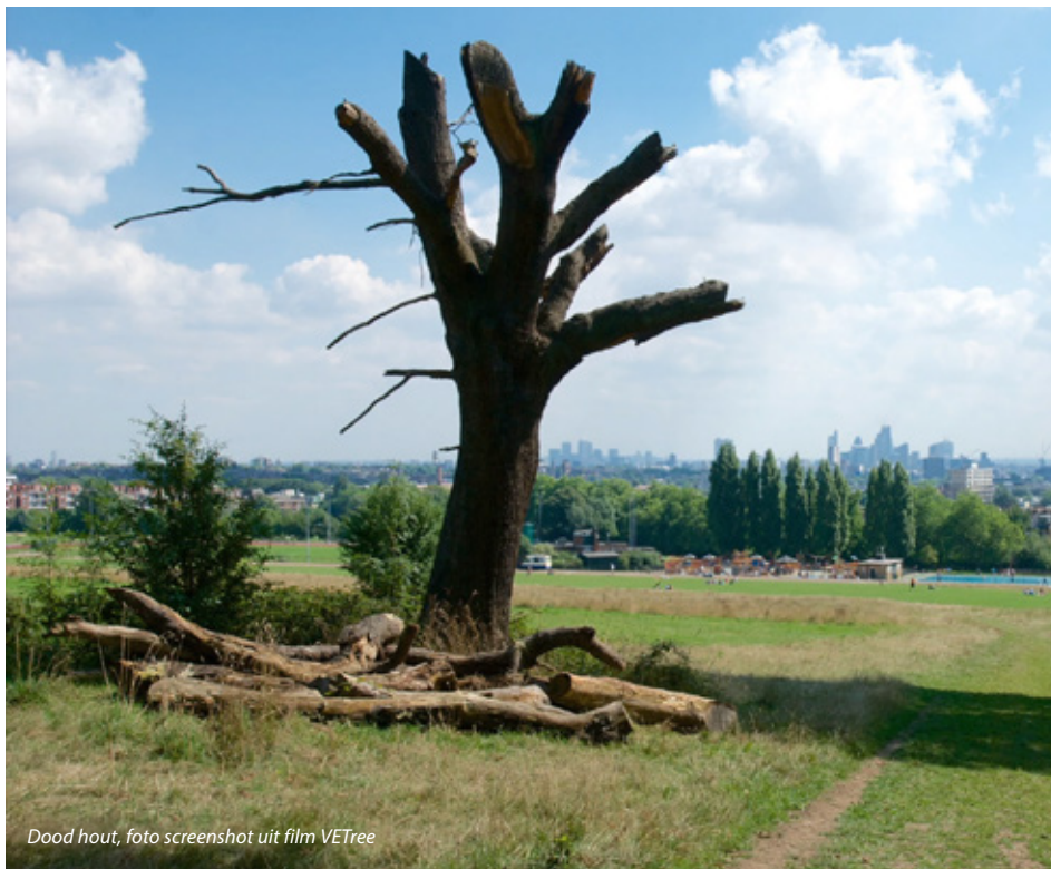
Dood hout, foto screenshot uit film VETree

Bengtsson wil niet beweren dat bomen niet gecontroleerd hoeven te worden op het risico van takbreuk of dat het niet uitmaakt als mensen vlak langs een wankele veteranboom lopen. Het is belangrijk om risico's te beheersen, maar wel passend bij de situatie. In de genoemde VETree-video wordt een aantal aanwijzingen gegeven. Een veteranboom in het buitengebied mag afsterven zoals hij dat van nature doet. Loopt er echter een wandelpad vlak langs of staat er bebouwing dichtbij, denk dan na over het verleggen van het pad of over kroonreductie. Dergelijke maatregelen zijn vaak goed voor de veiligheid én goed voor de boom.