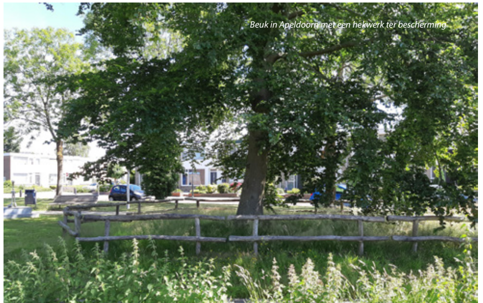
Beuk in Apeldoorn met een hekwerk ter bescherming

de eigenschappen waarom oude bomen gewaardeerd worden, dezelfde zijn als waarom ze als risico worden gezien: de karakteristieke uitstraling door het dode hout en de ecologische waarde. Tegelijk zorgt dat dode hout voor het risico dat de boom valt of takken laat vallen. Vallende takken kun je zien als een veiligheidsrisico, maar volgens Bengtsson is het ook een natuurlijke vorm van kroonreductie, onderdeel van het overlevingsmechanisme van de boom. Vallende takken horen er gewoon bij, en ze vallen slechts zelden op mensen.