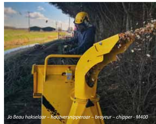
Jo Beau hakselaar – houtversnipperaar – broyeur – chipper - M400