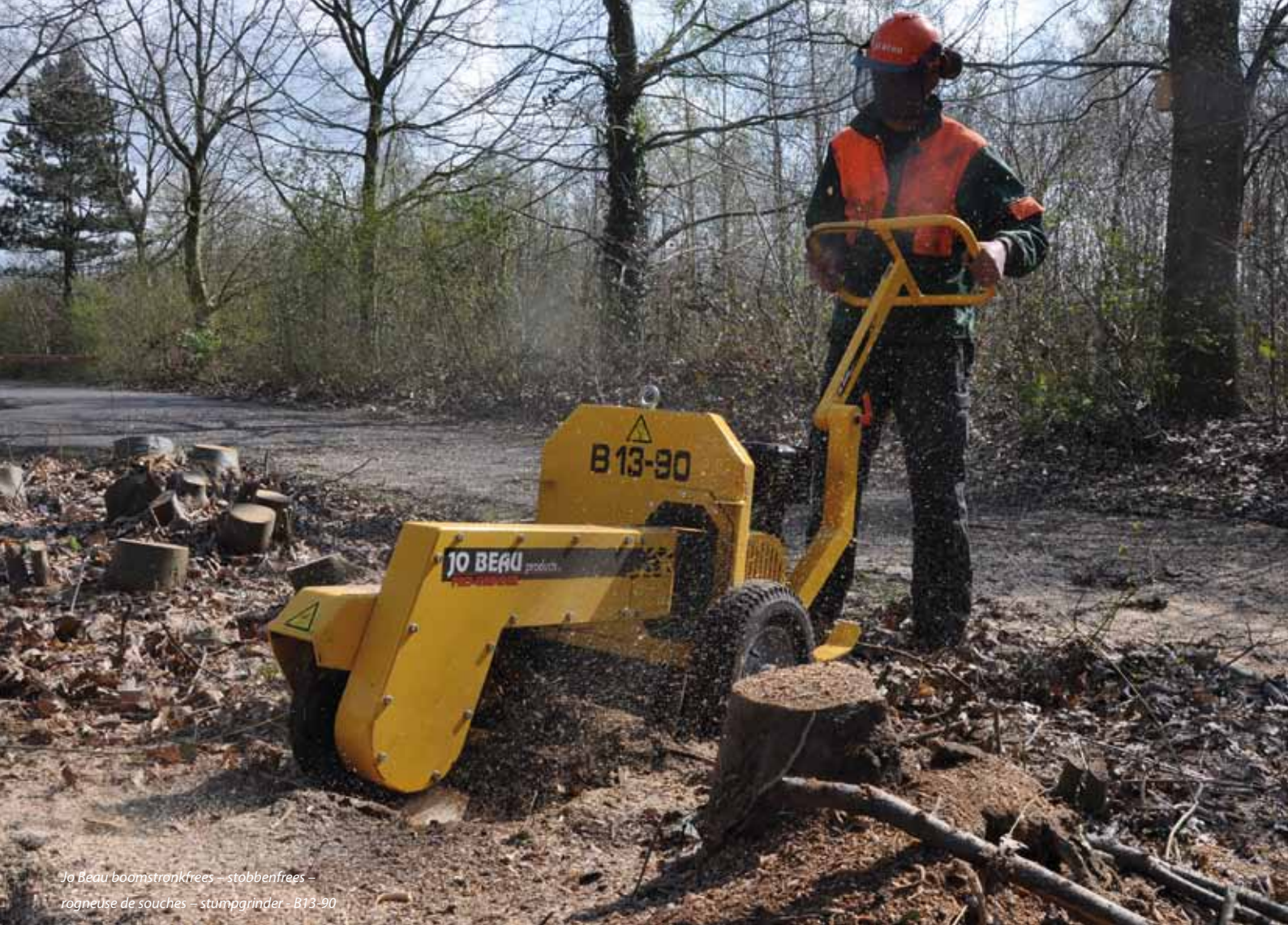
Jo Beau boomstronkfrezer – stobbenfrezer – rogneuse de souches – stumpgrinder – B13-90