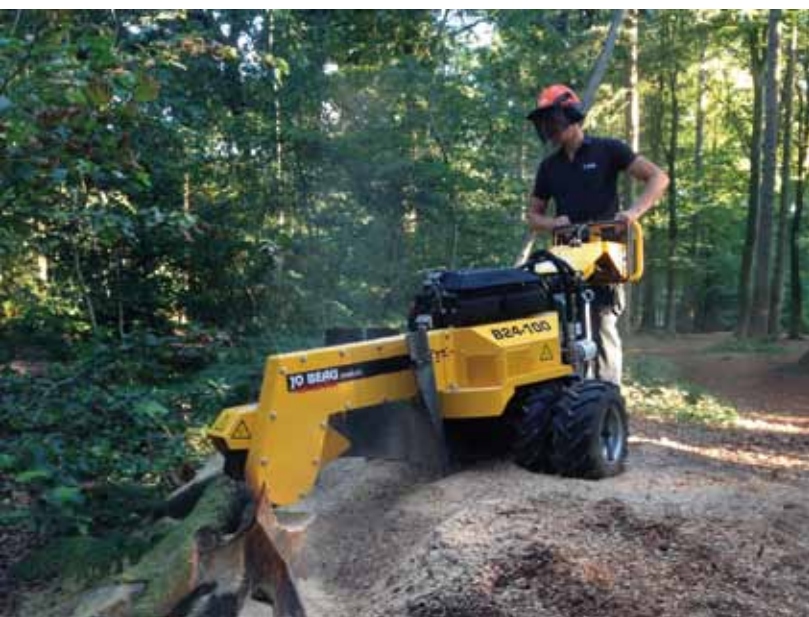
Jo Beau boomstronkfrees – stobbenfrees – rogneuse de souches – stumpgrinder - B24-100

zo gebouwd dat de wielen en het chassis kunnen worden geblokkeerd, zodat hij stil blijft staan terwijl de freesarm vrij kan zwenken op een draai-as. Ook met deze technologie waren wij de eerste op de markt. Later volgde een hele lijn hakselaars en stobbenfreesen en hebben we een hele serie uitgewerkt voor zzp'ers, boomverzorgers, verhuurbedrijven en gemeenten.' Jo Beau maakt ook machines op maat: elk model kan worden gepersonaliseerd met verschillende opties naar wens van de gebruiker. 'Er was een zeer grote vraag naar een smalle, ergonomische stronkenfrees met een grote capaciteit. Toen hebben we onze B24-100-stroonkenfrees met een breedte van 64 centimeter ontworpen, de smalste stobbenfrees in zijn categorie die er bestaat. Sinds hij in december 2016 op de markt kwam, is het een topseller.' Toch is de innovatieve kracht niet de enige troef van het bedrijf, vertelt hij. 'Denk ook aan zaken als onderhoudsgemak, duurzaamheid en ergonomie. Alles wordt geproduceerd in ons eigen bedrijf in België en we werken enkel met kwalitatief hoogstaande materialen; daar doen we geen concessies aan. Denk aan