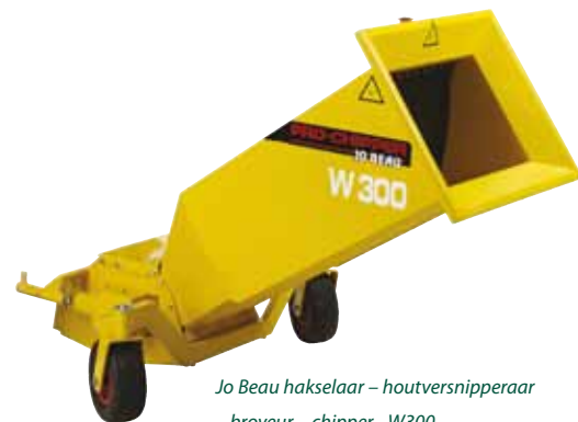
Jo Beau hakselaar – houtversnipperaar – broyeur – chipper - W300

Nadat de Jo Beau W300 & M300-versnipperaars het daglicht hadden gezien, volgden de innovaties elkaar snel op, vertelt Christophe. 'Denk aan de eerste B13-90-boomstronkfrees met de Jo Beau Pro-Grinder-technologie. Deze is qua ergonomie