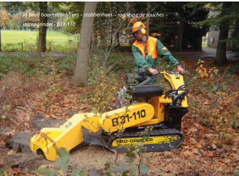
Jo Beau boomstronkfrees – stobbenfrees – rogneuse de souches – stümpgrinder - B31-110