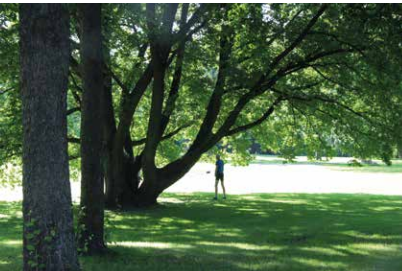
De oude eik en plataan van statuur