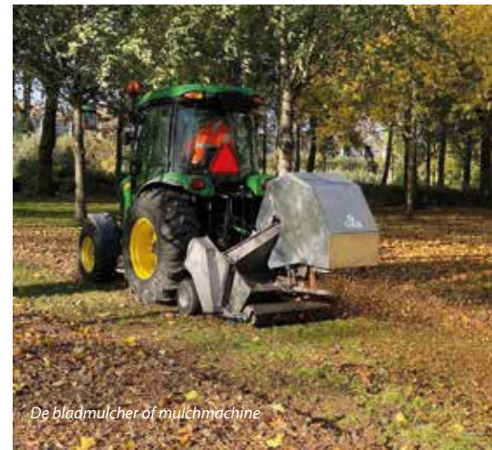
De bladmulcher of mulchmachine

Dieper in het Park lopen we tegen een reeks bouwhekken aan. Achter de omheining zijn bewerkte percelen te zien. 'Hier wordt gewerkt aan het park van de toekomst. We vervangen een gedeelte van het gras door struiken en bomen. Daarnaast is een aantal stenen paden weggehaald of vervangen door halfverharding met een sfeervolle uitstraling. Dat geeft meer een parkgevoel. Ook voeren we op dit moment proeven uit met halfverharding in boomspiegels. De gedachte is dat het water dan beter wordt gebufferd.' Als we halverwege het Park besluiten weer langzaam richting de auto te lopen, treffen we een schoolvoorbeeld aan van een zieke en een gezonde iep, pal naast elkaar. Een van de twee bomen is aangetast door de