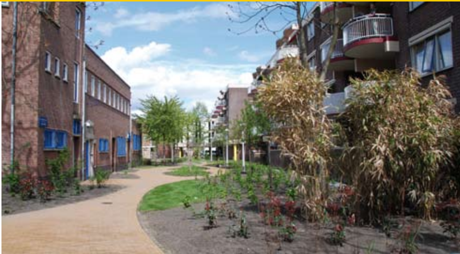
Entree van de Jan Wolkerstuin: de gebruikte vegetatie is zeer divers, van pollen met pampasgras, riet, bamboe, vlinderstruiken, kruidenplanten en geurende planten, klein fruit zoals bessenstruikjes en pruimenbomen tot veertien verschillende soorten bijzondere bomen.

volop speeltoestellen en er staat een buurthuis middenop het terrein. Het plein is versierd met prachtige grote Paulownia tomentosa's. De gevels van de huizen die er omheen staan, zijn met blauwe regen bekleed.