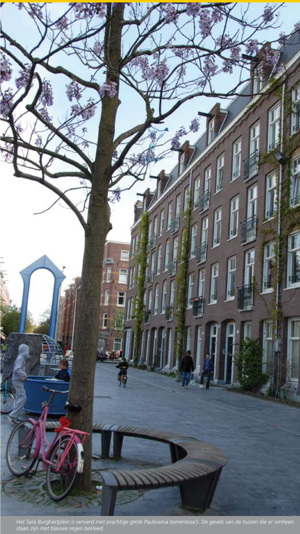
Het Sara Burghartplein is versierd met prachtige grote Paulownia tomentosa's. De gevels van de huizen die er omheen staan zijn met blauwe regen bekleed.