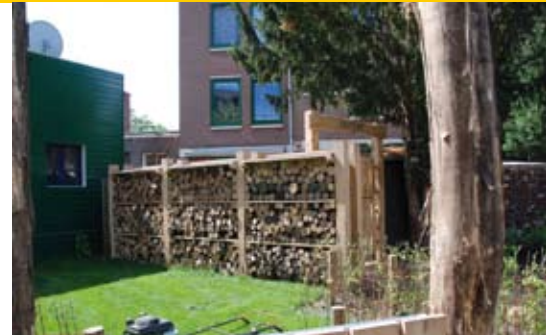
In een hoek van de Jan Wolkerstuin staat de 'insectencamping': een open kast met blokken hout en andere (an)organische materialen die vol zit met torretjes en andere insecten. De insectencamping is een leerelement voor kinderen.