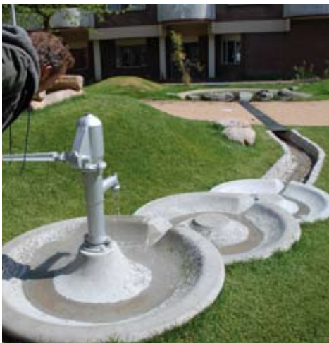
Een met de hand bedienbare pomp is een speelelement voor kinderen, die hiermee water van de heuvel naar een vijvertje kunnen laten lopen.

Een ander binnenterrein (zie hoofdfoto) tussen hemelhoge oude huizen middenin een winkelgebied laat een complete verrassing zien: een mediterrane rustplek! Palmbomen in bakken ("Trachycarpus fortunei kan wel tegen een stootje", aldus Ullie) met ringleidingen en tijdsklok voor watergiften, bamboeplanten langs de rand van het parkje, mozaïekafbeeldingen tussen de mooie padentegels en een fonteintje. 's Avonds schijnt er een groen licht tegen de gevels van de huizen, waardoor deze vergeten hoek van de stad ineens een romantische plek wordt. Wat moet dit dan wel niet gekost hebben?