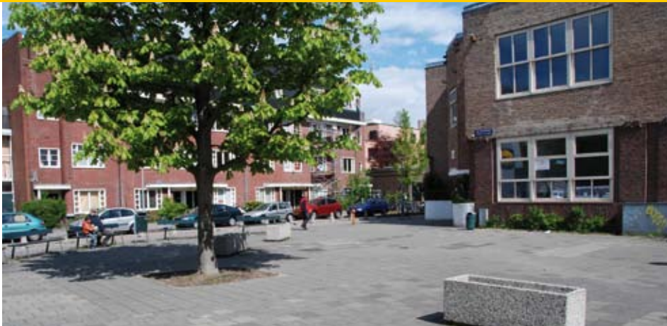
Deze plek is gedateerd: speeltoestellen uit de jaren '50, veel defensieve hekjes en stenen muurtjes en als groen slecht onderhoudbare en ontransparante prikbosjes.

defensief over en nodigen mensen niet uit om plaats te nemen. Ook de lage stenen muurtjes kunnen gemakkelijk vervangen worden door een Fagushaag. Nu zijn de wanden van de gebouwen wit, maar die kun je laten begroeien met pergola, of als contrast er één grote boom voor plaatsen.”