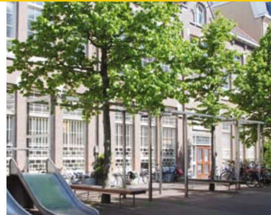
Elementen van een postzegelpark: vrolijke uitstraling, mogelijkheid tot dragen van een sociale functie en met name makkelijk te onderhouden voor de groenbeheerders.

houdend met die elementen? “Ik wilde er een natuurlijke kinderspeelplaats van maken, waarin natuurelementen zaten die kinderen op een speelse manier konden leren ontdekken, als tegenhanger van de playstation en gameboy. Kinderen lekker te laten rommelen met takken, water, beestjes en zand. Om dit opwindende speelelement goed uit de verf te laten komen, was het architectonisch van belang om de speelruimte niet-overzichtigelijk te maken” Ja, dat klopt, de spanning stijgt als er nog wat te ontdekken valt! De onoverzichtigheid is vormgegeven met twee grasheuveltjes, die het zicht in het midden van het parkje ontnemen. Op een van de grasheuveltjes laat een met de hand bedienbare pomp water via een open speelleiding