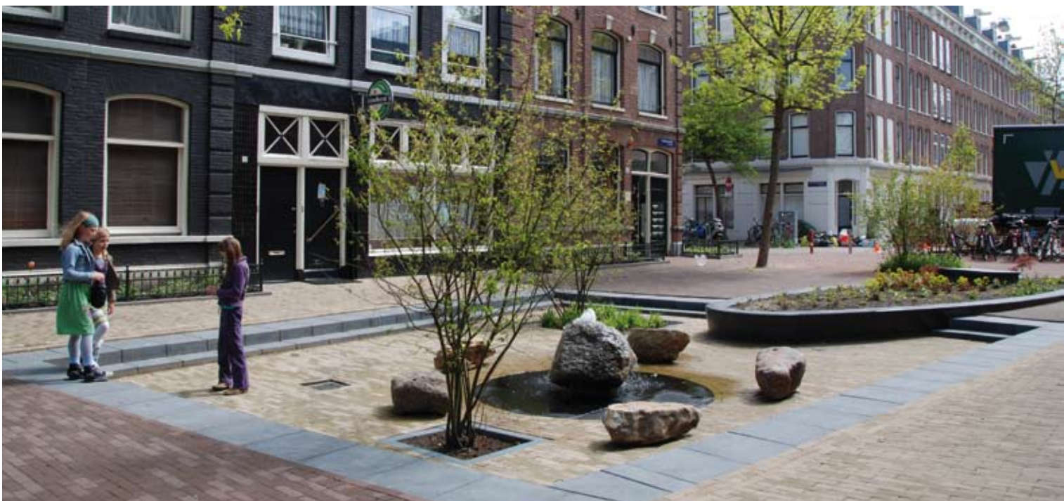
Ander voorbeeld van een postzegelpark

We lopen langs het leeraspect binnen het postzegelparkje: een ‘insectencamping’. Dat is een open kast met daarin opslag van houten blokken en (an)organisch materialen, die vol zit met kevertjes, torretjes en andere insecten. Ook is er een composthoop en zijn er planken