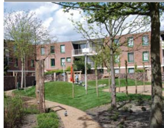
Heuveltjeslandschap: doordat de heuvels het overzicht ontnemen, valt er nog wat te ontdekken en dat maakt een landschap spannend.