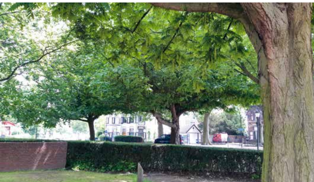
Kaukasische vleugelnoten op het Verploegh Chasséplein

Terug bij de werf zetten we de fietsen weer terug. Van der Burg komt nog terug op zijn plan met de groene haring. 'Mocht het plan niet doorgaan, dan komt het waarschijnlijk helemaal te vervallen, omdat er verder geen plekken zijn waar deze haring genoeg ruimte heeft.' In plaats daarvan zullen de bomen als individuen elders worden geplant en zal Van der Burg op zoek moeten naar andere kabel- en leidingvrije boomplantplaatsen. 'Dat is vaak nog de grootste uitdaging bij het plannen van bomen; plekken vinden waar het kan. Want met boomkronen kan je nog redelijk variëren, met wortels is dat een ander verhaal. Stedelijk gebied krijgt steeds meer ondergrondse infrastructuur, en daar tussendoor moeten dan nog wat bomen. Met de hoge grondwaterstand hier in Vlaardingens erbij is de uitdaging compleet. Het hoort allemaal bij het plaatje, en zo houd ik mijn collega van Riolering ook een beetje bezig. Dan staat hij weer naast mijn bureau wanneer hij een wortelpakket uit zijn buizen heeft getrokken en begint hij erover dat we onze bomen hierop moeten aanspreken. Ik verwijs hem dan naar de wortelwerende buizen die in het magazijn naast de bougievonkjes liggen,' lacht Van der Burg.