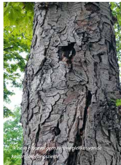
'Ik zie in elk geval geen nieuwe plekken van de kastanjabloedingsziekte'

vond het een leuk idee, maar wees me er wel op dat dit een stuk grond is met mogelijk hoge archeologische waarde. Dus dat er eerst grond-boringen gedaan zouden moeten worden om zeker te weten dat de bomen niet voor schade gaan zorgen. Nou is geschiedenis wel een hobby van me, maar dit is natuurlijk een uitdaging waar ik van tevoren helemaal niet aan had gedacht. Maar ach, ik zie het weer als een nieuwe ervaring en wie weet wat we nog vinden!