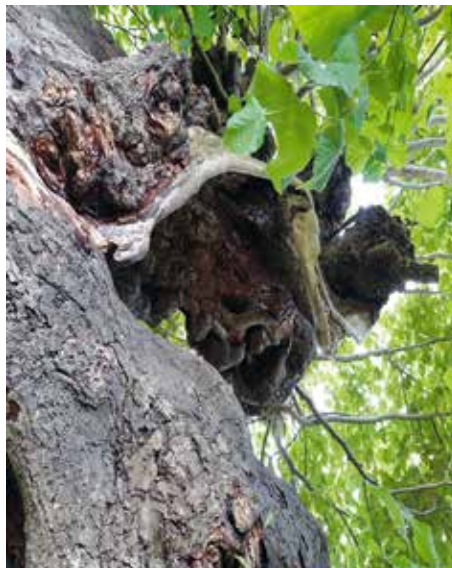
Vergroeiing in de oudste linde van Vlaardingen

De infraroodbehandeling werd uitgevoerd door idverde, met technische ondersteuning door TreeHold. Bij deze behandeling wordt de stam ‘ingepakt’ met infraroodpanelen die de stam