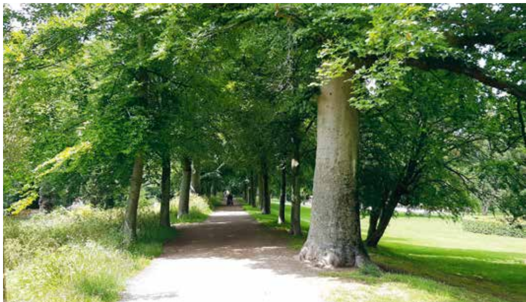
Beukenlaan met risico op zonnebrand

'Er verdwijnt een flink stuk groen voor de aanleg van de nieuwe A24. Dit wordt gecompenseerd met nieuwe bomen of struiken. In één seizoen gingen we 1400 bomen aanplanten'