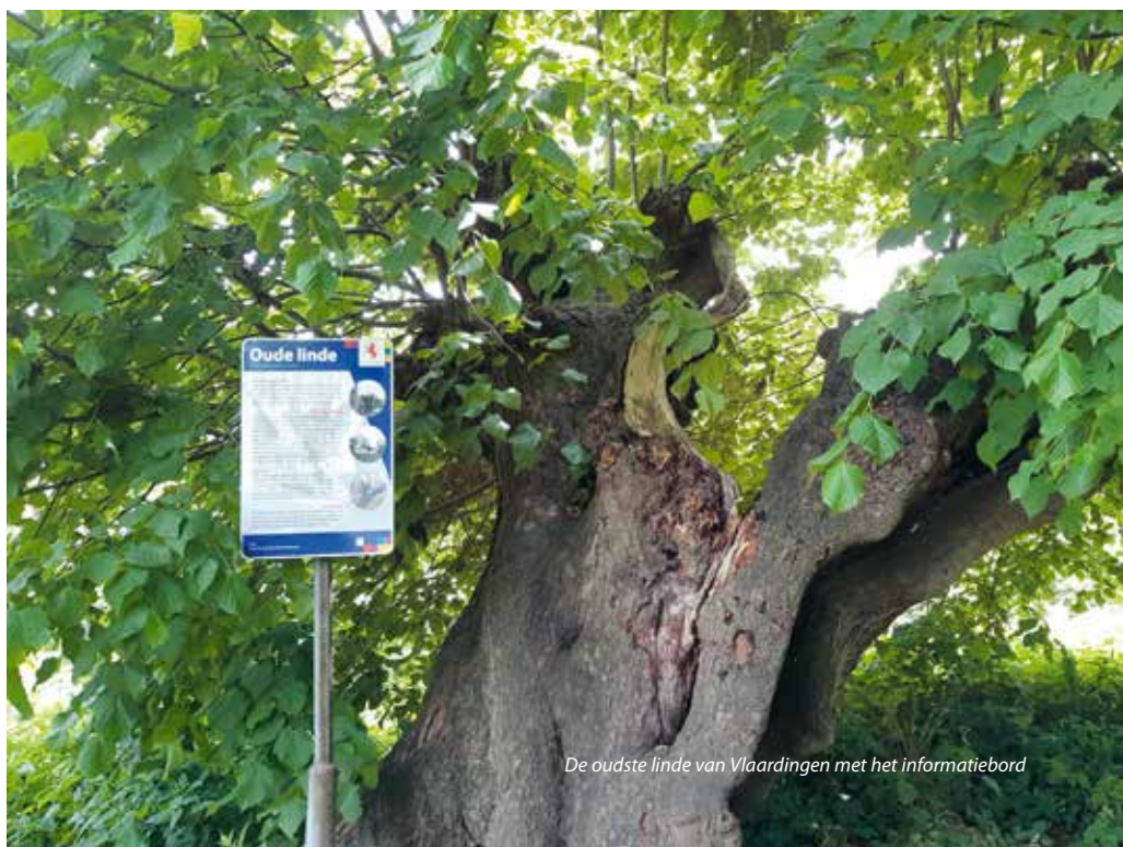
De oudste linde van Vlaardingen met het informatiebord