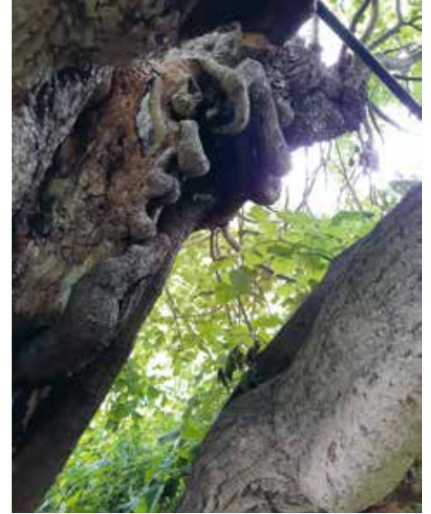
De oude linde op het landje van Chardon is volledig hol

verwarmen tot 44 graden Celsius, een temperatuur die de boom nog kan verdragen, maar waarbij de schadelijke bacteriën doodgaan. De stam of tak moet een uur of vier ingepakt blijven en daarna is het hopen dat de boom het wint van de ziekte.