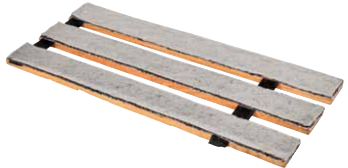
Binnenkant van de Dendro Tree Wear.

ITS kiest dus voor de vraag vanuit de markt. Dat doet het bedrijf niet alleen met zijn website, maar ook met zijn producten. Duurzaamheid