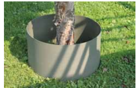
Dendro Bio Gietrand.

Met Dendro Tree Wear beschikt het bedrijf bovendien over een uitstekend herbruikbaar systeem. Dendro Tree Wear is een kant-en-klare stam ommanteling om schade aan de stam te voorkomen bij werkzaamheden. Aan de binnenkant van de ommanteling zit een speciale ademende drainmat bevestigd om beschadiging en aantasting te voorkomen. Het product is eenvoudig en snel te plaatsen, zit compact verpakt en is in grote aantallen te vervoeren. ITS probeert boomverzorgers dus op allerlei manieren te helpen. Het is bijvoorbeeld niet altijd makkelijk om tijdens boomonderzoek een prikstok en hamer mee te nemen. ITS heeft