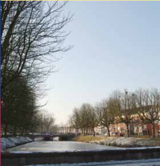
Aesculus hippocastanum 'Baumannii' gepland net voor en net na de oorlog.