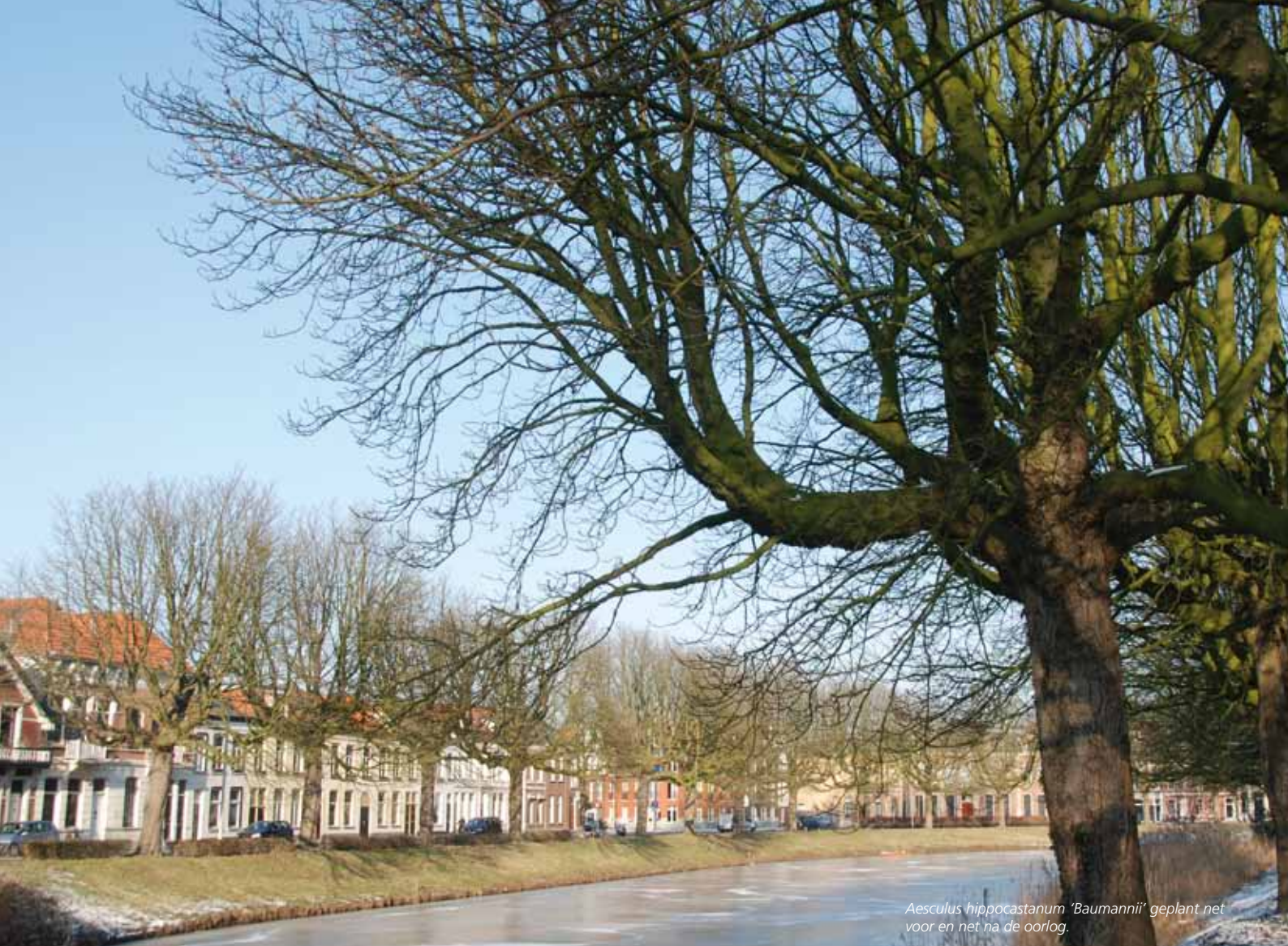
Aesculus hippocastanum 'Baumannii' geplant net voor en net na de oorlog.