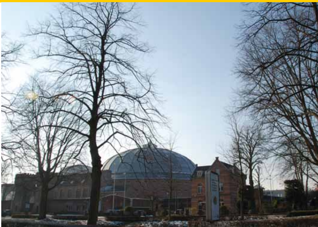
Tilia platyphyllos, geplant in 1960 (voorgrond), Acer saccharinum 'Elegant' geplant in 1925 (achtergrond gevangeniszijde).

'Ik voel passie voor bomen vanwege de hoge leeftijd die ze kunnen bereiken. Door hun hoge leeftijd krijgen ze een indrukwekkend uiterlijk. Ze zijn blijvende structuurdragers. Maar ook kent Breda veel monumentale bomen langs de singels en in de parken. We hebben een aantal oude moerbeibomen, een zeer oude tamme kastanje en een oude vleugelnoot. Daar wordt geld aan uitgegeven; dit in de vorm van bijvoorbeeld stormankers of extra steunen om uiteenvallen tegen te gaan. Behoud is belangrijk, want zij geven de stad aanzien. Breda heeft in totaal 90.000 geregistreerde bomen, de meeste kerngezond. Natuurlijk heb ik de ambitie om stappen te zetten in de richting van groeiplaatsverbetering, maar de