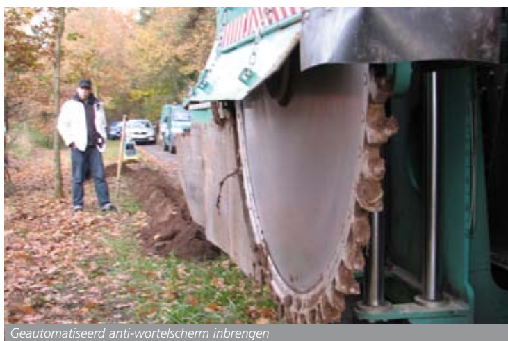
Geautomatiseerd anti-wortelscherm inbrengen