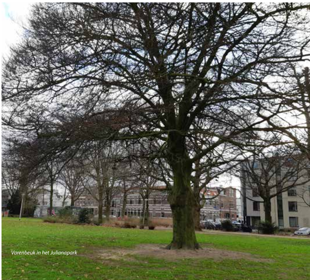
Varenbeuk in het Julianapark