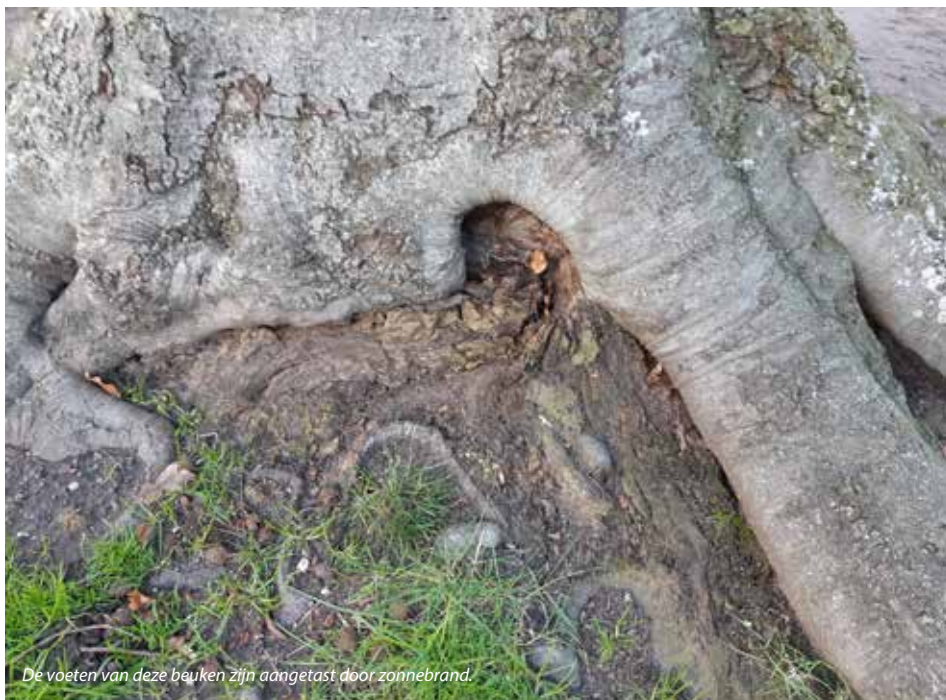
De voeten van deze beuken zijn aangetast door zonnebrand.