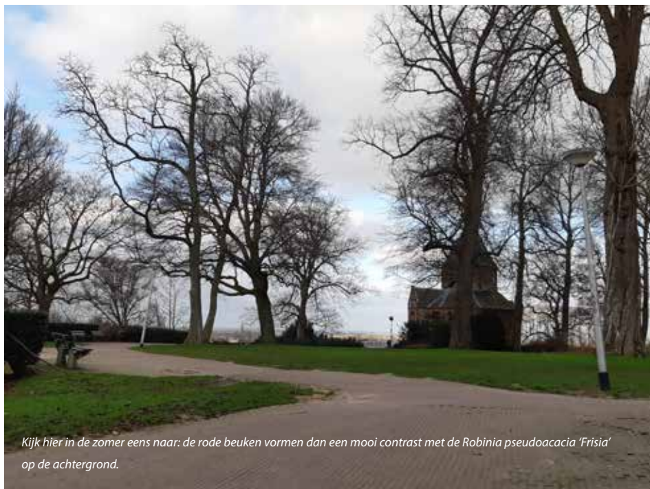
Kijk hier in de zomer eens naar: de rode beuken vormen dan een mooi contrast met de Robinia pseudoacacia 'Frisia' op de achtergrond.