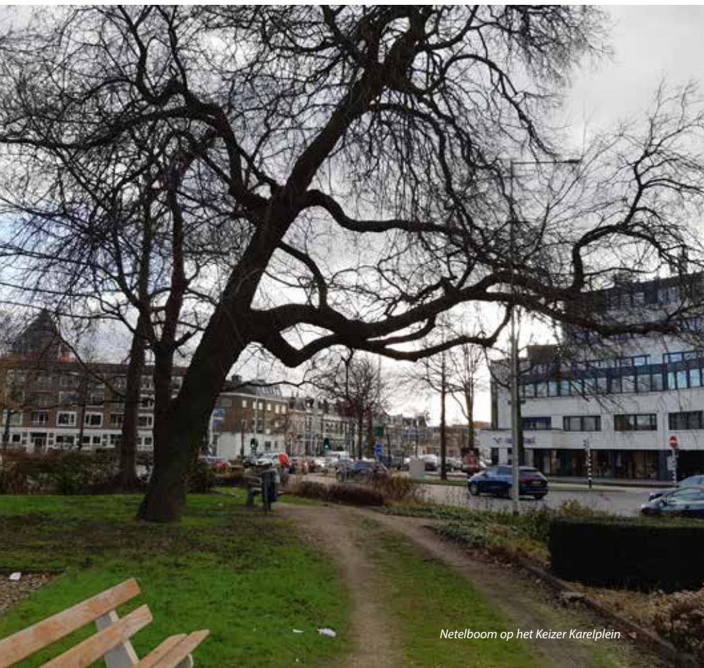
Netelboom op het Keizer Karelplein

Nijmeegse bodem. 'De stad ligt hoog en de bodem bestaat hier vooral uit zand, hoewel in mindere mate ook veel andere bodemsoorten voorkomen. In het verleden werden bomen regelmatig gewoon aangeplant in het zand. Stratenmakers verzorgden de klus door het zand goed aan te trillen voordat de bestrating werd aangelegd. Dat betekende voor de boom helaas een sterk verdichte bodem, waar nauwelijks voeding en eigenlijk geen lucht in zat. Tegenwoordig pakken we dat gelukkig anders aan, vaak met substraten of door te werken met open plantvakken. Om teveel grondverplaatsing te voorkomen, hebben we bovendien een slimme oplossing bedacht: in plaats van al het zand halen we maar een deel ervan weg en dit volume vervangen we door een verrijkmix. Hierbij wordt één derde van het zand weggehaald en vervangen door een voedingsrijk grondmengsel, dat door het zand heen wordt gewerkt. Op plaatsen waar meer draagkracht nodig is, gebruiken we een substraat met een stabiliserende steenfractie, wat meer draagkracht oplevert en tegelijk ruimte laat voor lucht, water en wortelgroei.'