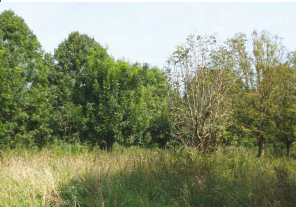
Uit de essenzaadgaard Vaartbos bij Zeewolde wordt teeltmateriaal in de vorm van zaad uitgegeven door Staatsbosbeheer.

CGN kan het niet alleen, wil Kopinga benadrukken: 'Dit jaar kunnen we nog weinig van het onderzoek afronden.' Hij klinkt teleurgesteld. 'Omdat het Productschap Tuinbouw eind 2013 ophoudt te bestaan, moet zij haar activiteiten momenteel al afbouwen. Het is zeer de vraag of dat in deze afbouwfase er nog geld zal zijn voor verder onderzoek naar resistentie onder essen.' 'Het zou internationaal een zwaktebod zijn als we met ons onderzoek moeten afhaken. Zowel de sector als de gebruikers kunnen dit niet op hun beloop laten. Ik zou graag zien dat er een cofinancieringsmodel wordt opgericht tussen de overheid en de sector. Als het de overheid duidelijk is dat er een cofinanciering zal komen vanuit belanghebbenden, zal zij namelijk eerder "ja" zeggen, zo is mijn ervaring. En vice versa. En dat zou betekenen dat het onderzoek door zou kunnen gaan.'